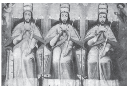
Imagen de la Trinidad, de la escuela de Cuzco, siglo XVIII, prohibida por la Santa Sede por inducir al tri-teísmo.

de matemática a quien se le quisiera explicar la teoría de la relatividad, o el funcionamiento de la economía mundial.