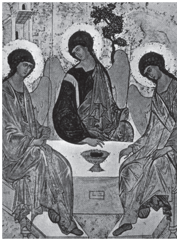
El ícono de la Trinidad. RUBLEV, año 1411

No son tres dioses. Entre nosotros, tres personas serían tres hombres. En Dios las tres Personas no son tres ‘individuos’, sino un solo Dios. No lo entendemos demasiado porque nosotros usamos la palabra “persona”, cuando nos referimos a los hombres, de un modo distinto a cómo la usamos cuando nos referimos a Dios. (Algunos estudiosos para que no entendamos mal el término “Persona”, prefieren usar otra palabra “hipóstasis”. Tres “Hipóstasis”, un solo Dios). Él está mucho más allá de nuestras palabras y de todo lo que podamos entender de Él. Somos, respecto a Él, como un ciego de nacimiento a quien alguien quisiera describir los colores. Como uno que no sabe nada