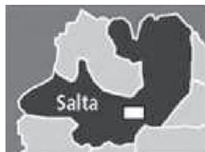
La misteriosa ciudad de Esteco