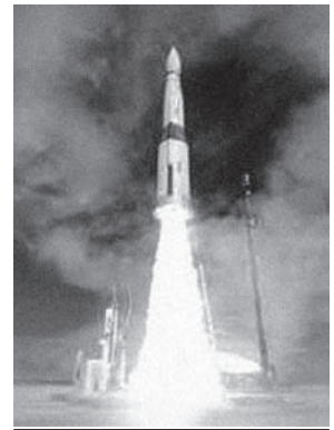
El hombre conquista el universo

La Caridad es una fuerza de amor divino, de querer, que nos da la capacidad de querer lo que Dios quiere, y amar como Jesús ama. Esa es la principal de