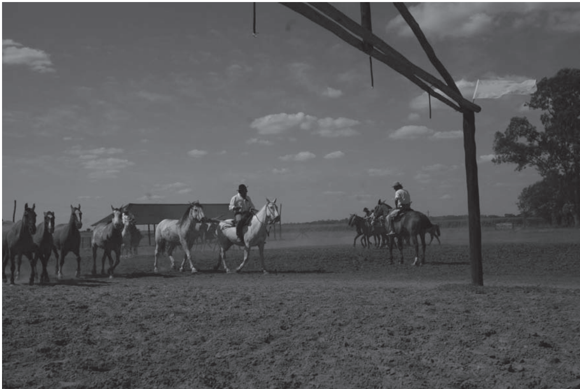
Paisanos de la provincia de Buenos Aires.

Mediante el trabajo ofrecido a Dios, el cristiano practica las virtudes teológicas.