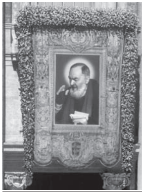
El hombre se hace capaz de llegar al cielo

La Fe , ya lo hemos afirmado en la lección dos, aumenta nuestro saber, nuestra inteligencia.